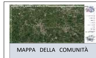
MAPPA DELLA COMUNITÀ

Enti, Associazioni e Imprese del Territorio